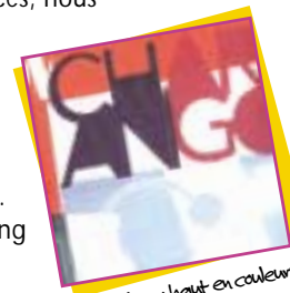
"Charango", l'album haut en couleurs et en sonorités de Morcheeba

On a mis beaucoup de temps à le développer. On a travaillé dur et c'est venu très doucement. Lors de nos précédentes expériences, nous avons appris comment faire un album, comment écrire des morceaux, enregistrer, faire les arrangements avec un orchestre, mixer, produire. Vous savez c'est un très long processus. Nous voulions faire quelque chose qui plaise à chacun de nous.