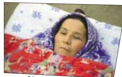
"L'ange de l'épaule droite" de D. Usmanov.

Elle s'intitule "Terres d'ici et d'ailleurs" et proposera un ensemble de films du monde entier dont l'action se situe principalement en milieu rural ou qui privilégient les paysages, l'environnement... Nous présenterons aussi un programme de courts métrages et une rétrospective consacrée à Manuel Poirier avec peut-être la présence de Sergi Lopez... Comme à l'accoutumée, il y a également des rencontres avec des professionnels : des réalisateurs, des actrices et des acteurs, des critiques et des universitaires... Des débats seront