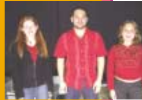
Léa et Amandine avec Ross, guitariste et compositeur de Morcheeba

Prochain numéro : chronique du lycée Léonard de Vinci de Montaigu (85).